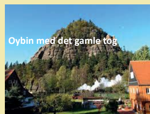
Oybin med det gamle tog