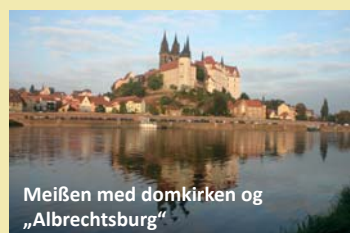
Meißen med domkirken og „Albrechtsburg“