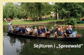
Sejlturen i „Spreewald“