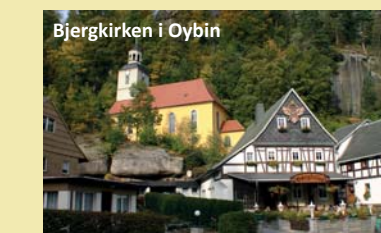
Bjergkirken i Oybin